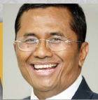
Dr. (HC) Dahlan Iskan Mantan CEO Jawa Pos dan Jawa Pos Group Mantan Menteri Negara BUMN "Pendidikan Tinggi dan Dunia Kerja"